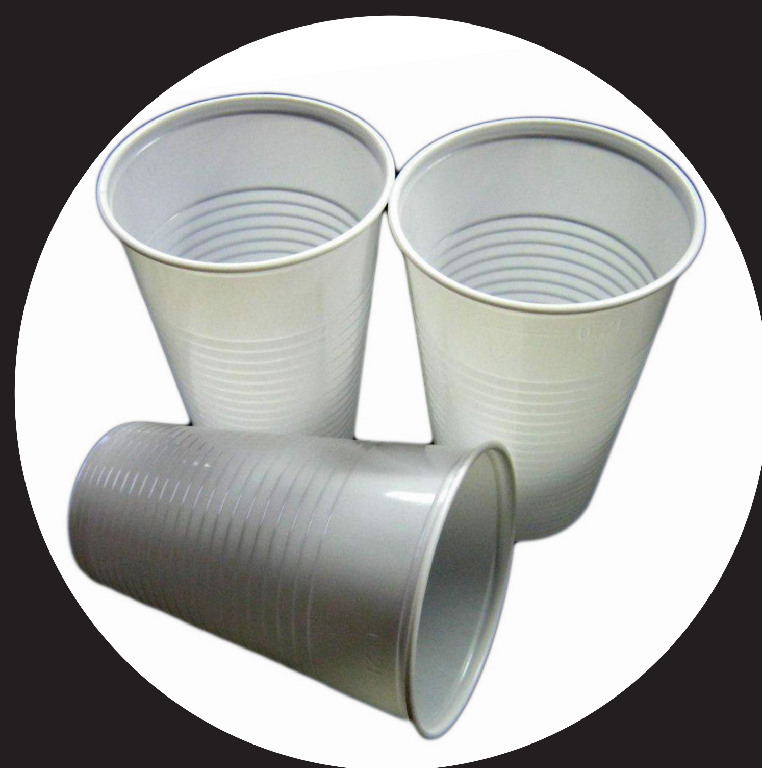
Plastikowy kubeczek 75 lat