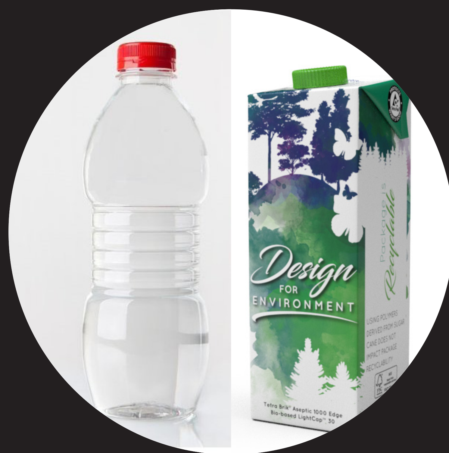
Butelka PET lub pudełko Tetra Pak 100 lat