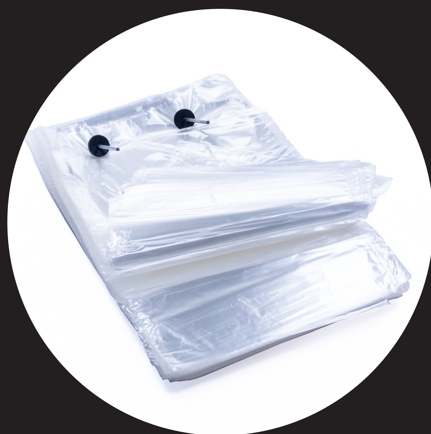
Woreczek nylonowy 25 lat